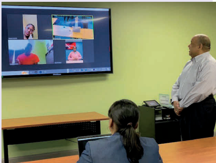
El Nuevo "Zoom Room".