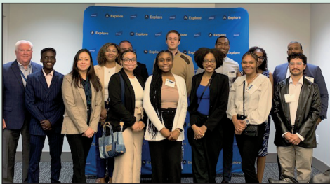
Becarios del WYSP fotografiados con dirigentes de Baird

El evento fue un éxito y los funcionarios de Baird tienen previsto ampliarlo en los próximos años con la participación de más estudiantes universitarios asociados corporativos.