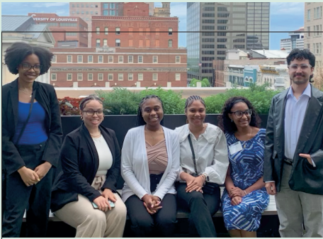
Becarios de WYSP en las oficinas de Baird.

Baird, uno de los valiosos asociados corporativos de Lincoln Foundation, organizó recientemente una jornada de puertas abiertas para poner en contacto a universitarios